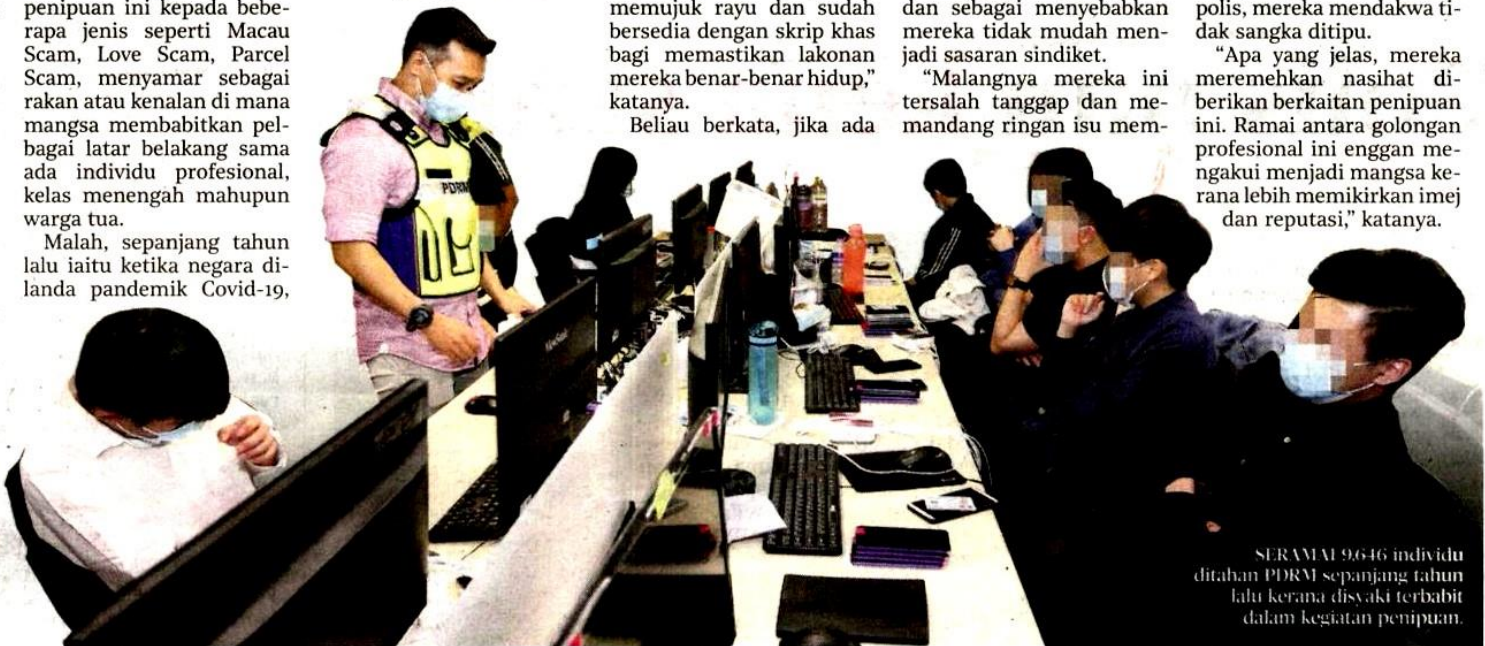
SERAMAI 9,646 individu ditahan PDRM sepanjang tahun lalu kerana disyaki terbabat dalam kegiatan penipuan.

"Apa yang jelas, mereka meremehkan nasihat diberikan berkaitan penipuan ini. Ramai antara golongan profesional ini enggan mengakui menjadi mangsa kerana lebih memikrkan imej dan reputasi," katanya.