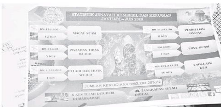
FAKTA: Carta statistik kes penipuan dalam talian yang direkodkan di Bintulu pada tahun 2020.

ciri-ciri keselamatan ditetapkan kepada pemilik akaun sebaliknya pemilik akaun memberikannya kepada orang lain (suspek) yang akhirnya wang simpanan pemilik akaun hilang.